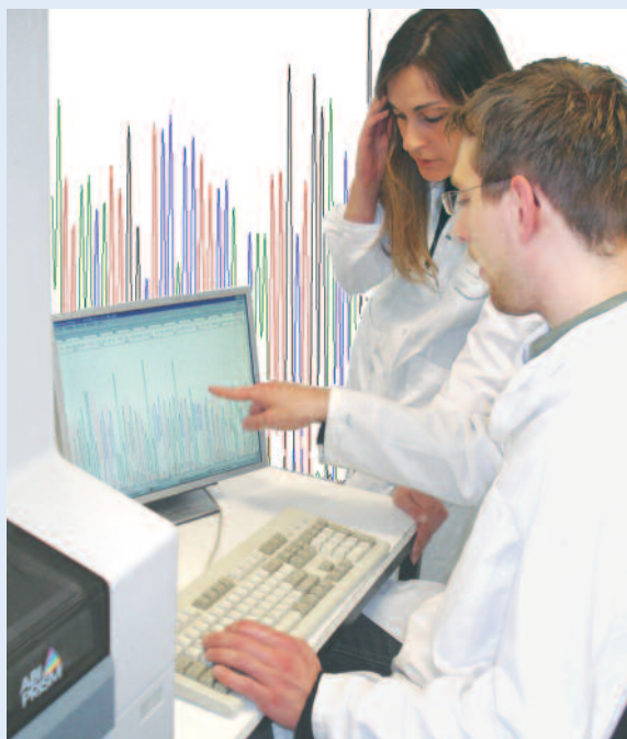
Auswertung der Sequenzierung einer Patienten-DNA

In der postnatalen zytogenetischen Diagnostik werden die Chromosomen bereits geborener Personen untersucht, wenn ihr klinisches Bild oder ihre