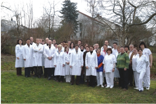
Mitarbeiter der Klinik