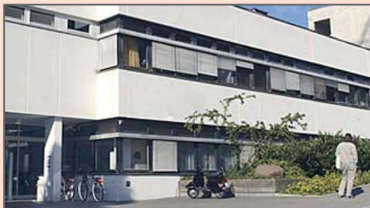
① Eingang Frauenklinik