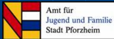
Amt für Jugend und Familie Stadt Pforzheim