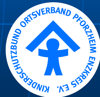
Kinderschutzbund Pforzheim Enzkreis e.V.