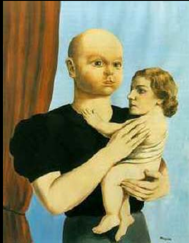
Der Geist der Geometrie, 1936/37